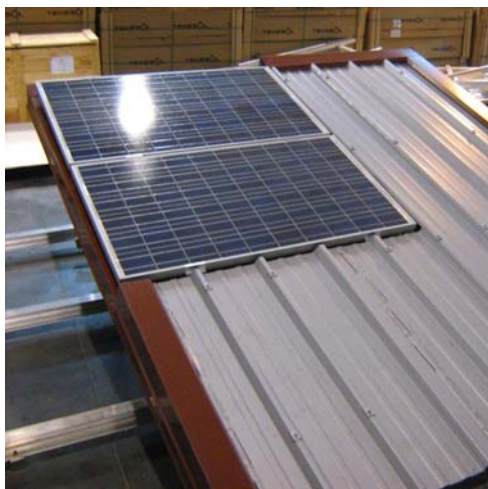
Fixation des modules sur le toit lattes

Noter: avant l'installation, le client doit contacter la compagnie pour assurer la compatibilité des modules avec le système de fixation.