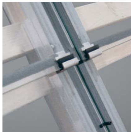
Dettaglio telaio e agganci